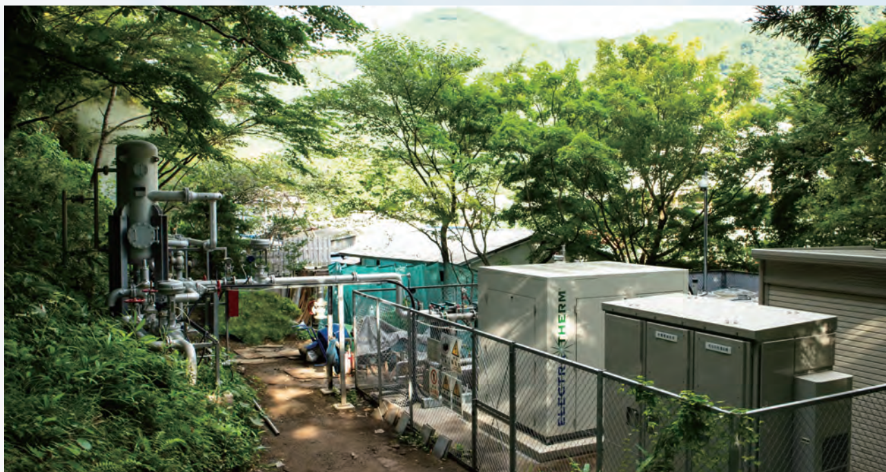
宮城県65kWバイナリー発電所 2018年運開