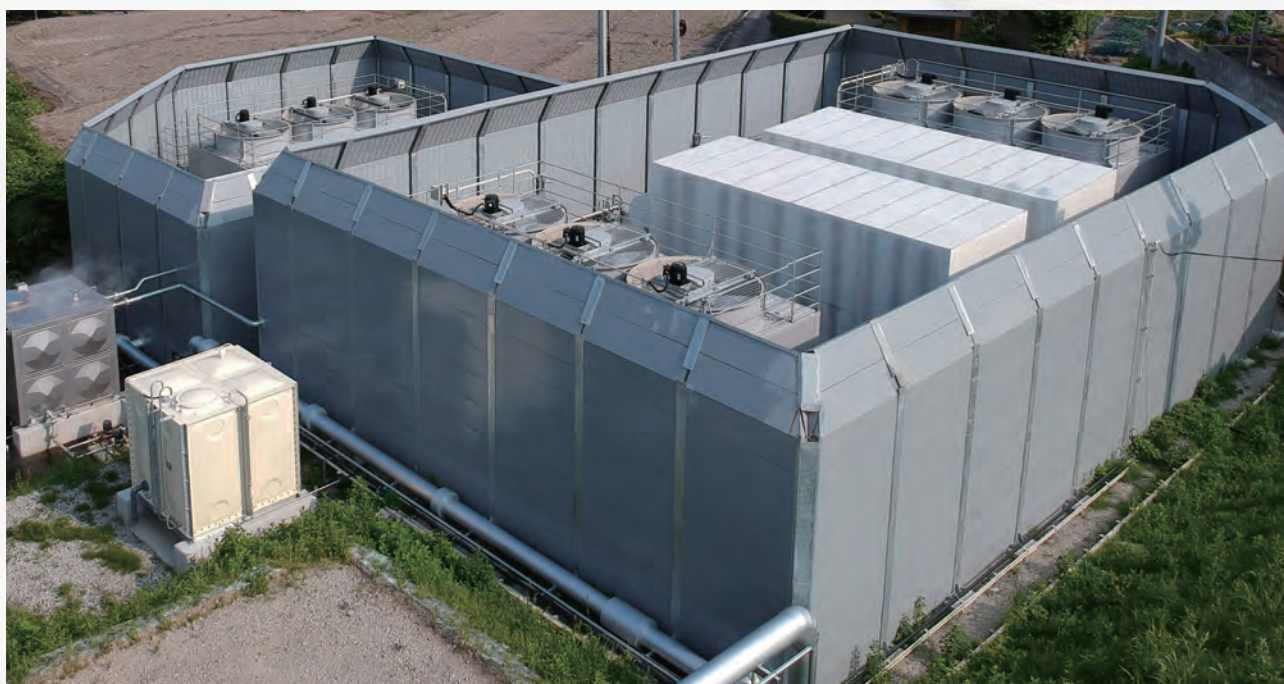
大分県840kWバイナリー発電所 2019年運開